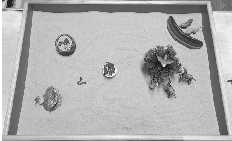
Figure 1. Sandpicture 1

The child described the sandpicture as follows: “There’s a forest and a peaceful village, but a wolf is wandering around here trying to hunt the animals. Then a mysterious power…a rainbow blocked the wolf, and it became a safe village again. The wolf was concealed, and the village became safe again, and so turtles and frogs were born inside the well.”