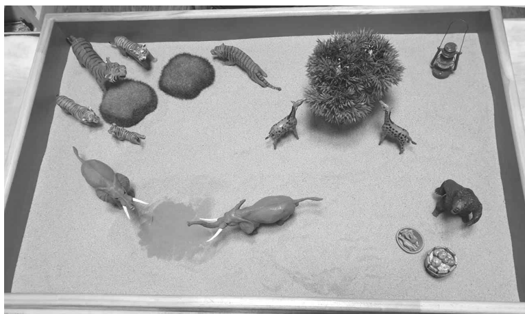
Figure 2. Sandpicture 2

A 13-year-old girl was referred for counseling with the primary complaint of impulsive behavior during school classes and difficulties in peer relationships. According to the mother, the child only complied when subjected to strong physical punishment, and the mother did not tolerate any situations or behaviors that deviated from the rules she had established. Whenever such deviations occurred, the child would cry for extended periods and exhibit intense tantrums.