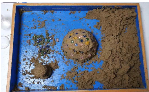
Figure 11. Sandpicture from Session 15