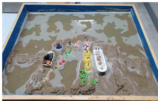
Figure 5. Sandpicture from Session 8

they are often regarded as heroes who protect and defend people from threats (Rubin, 2007). In session 7, wounded maternity is healed through the appearance of a “doctor husband,” and “three children secretly eating cake” appear. This signifies that the ego has begun to obtain the previously lacking maternal nourishment (food) on its own, and the number three, as a symbol of integration, represents the ego achieving balance between the unconscious and consciousness and moving toward the integration of personality (Jung, 1964). The client also