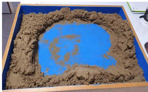
Figure 10. Sandpictures from Session 14