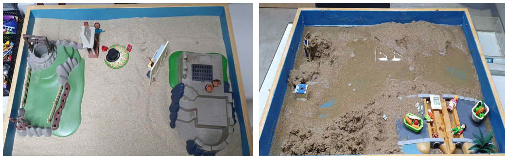
Figure 2. Sandpictures from Session 3

Similar sandpictures also appeared in sessions 2 and 3. In session 2, the client built a house and engaged in cleaning play. In general, home symbolizes maternal and protective aspects (Cooper, 1978/1994; Jung, 1964). The need to build a sturdy home seemed to signify its current instability and the client's desire to protect herself from the harsh world portrayed by a sandstorm. Using a broom to tidy up chaotic areas felt like an attempt to organize