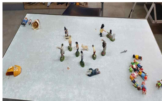
Figure 7. Sandpicture from Session 11