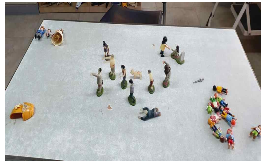
[그림 7] 11회기 모래놀이장면

10회기에서 내담자는 ‘뱀파이어 부모’를 등장시키는데, 아빠 뱀파이어가 자살하고 엄마가 곰 발톱에 죽는 모래놀이장면 이야기는 성장을 저해하는 부정적 부모 에너지를 심리적으로 제거하려는 자아의 투쟁을 보여준다. 이어지는 11회기에서 태어난 아이들을 잡아가려는 ‘좀비’들과 대치하는 모래놀이장면이 등장한다. 좀비는 죽음을 육신으로 드러내며 언젠가는 닥칠 ‘현실적 죽음’을 상징하며 동시에 공포의 감정을 불러일으키는 존재라고 할 수 있다(김민오, 2014). 좀비는 살아있는 것처럼 보이지만 죽은 존재로 오직 무의식적으로만