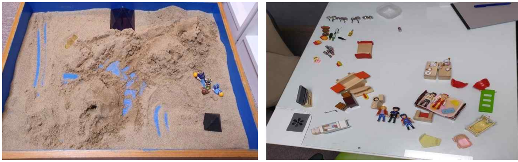
Figure 4. Sandpictures from Session 7

they are often regarded as heroes who protect and defend people from threats (Rubin, 2007). In session 7, wounded maternity is healed through the appearance of a “doctor husband,” and “three children secretly eating cake” appear. This signifies that the ego has begun to obtain the previously lacking maternal nourishment (food) on its own, and the number three, as a symbol of integration, represents the ego achieving balance between the unconscious and consciousness and moving toward the integration of personality (Jung, 1964). The client also