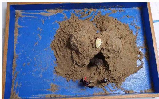
Figure 6. Sandpicture from Session 10

The magic-war ego stage is a period marked by a shift from the maternal to the paternal realm, during which the ego engages in a full-scale struggle to break free from domination by the unconscious and negative mother (Jang, 2024). This shift toward the paternal signifies not remaining in emotional confusion and trauma imposed by the unconscious (i.e., the