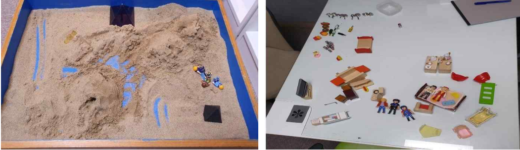
[그림 4] 7회기 모래놀이장면