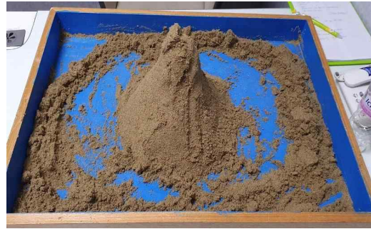
Figure 9. Sandpicture from Session 13