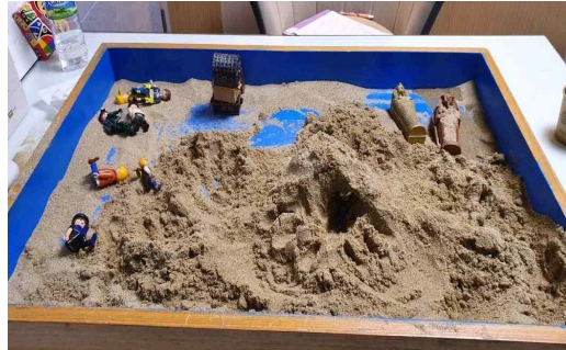
Figure 3. Sandpicture from Session 6