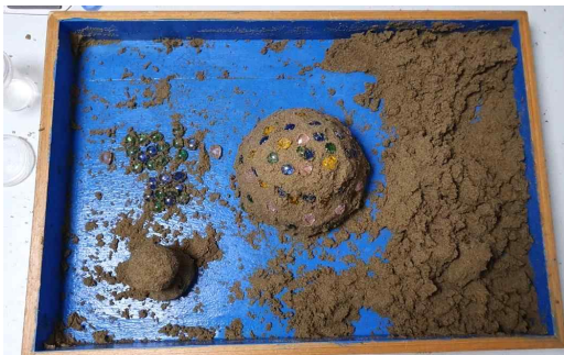
[그림 11] 15회기 모래놀이장면

는 사막은 내담자의 안에게 치유가 일어나고 있는 것 같다는 느낌을 받았다. 13회기에서는 침묵 속에 산과 동굴을 반복적으로 만드는 행위를 했는데, 산은 무의식의 상징으로 대모를 상징하기도 한다(Campbell, 1988; Jung, 1964). 또한 산을 올라가는 것은 영적 성장과 자기실현을 상징한다(Jung, 1964). 즉 내담자가 모성성을 회복하고 자기실현을 하고자하는 작업이다. 14회기에서는 분노를 상징하는 화산을 부수고 그위에서 물로 손을 씻었다. 손은 상처를 극복하거나 치유하는데 필요한 에너지와 소통하게 만드는 역할을 한다(장미경, 2024). 즉, 전쟁 과정에서 발생한 파괴적 본능을 다스리고 성적 트라우마를 씻어내려는 정화과정이다.