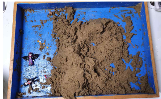
[그림 12] 16회기 모래놀이장면

15회기에 내담자는 보석으로 장식된 케이크를 만들며 축제적 분위기를 만들었다. 케이크 위에 파란색과 초록색 보석을 하나로 합쳐 올렸다. 초록색은 원시적이고 근원적인 생명의 힘을 상징하며, 파란색은 동양권에서 음양 중 음, 즉 여성성을 상징한다(Cooper, 1978/1994). 즉 분열되어 있던 심리적 에너지들을 자아의 의지로 통합하려는 대극의 합일을 상징한다. 또한 ‘♥맘♥’이라는 글자와 눈사람은 눈사람을 만들었다. 눈사람은 두개의 원모양이 위로 붙어있는 모습으로 이는 자기가 배열되고 자아가 독립하기 시작하는 것으로 보인다(장미경, 2024). 16회기에서는 모래로 눈싸움 놀이를 한다. 눈은 부드럽고 아름다운 까닭에 보이지 않는 진리, 숨겨져 있는 지혜를 상징하기도 한다(Fontana, 1993/1998). 이는 자아 내면의 공격성과 갈등을 안전한 방법, 부드러운 눈으로 표출하고 다루는 법을 익히는 과정이다. 또한, 순두부를 만들어 형편이 어려운 아이들에게 공짜로 나누어 주는 놀이에서는 결핍에 시달리던 과거의 자아에서 벗어나, 이제는 스스로 자원을 생산하고 타인에게 배분할 수 있는 건강한 자아가 성장했음을 보여준다.