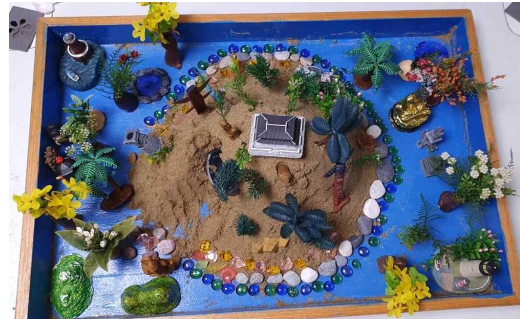
Figure 14. Sandpicture from Session 19