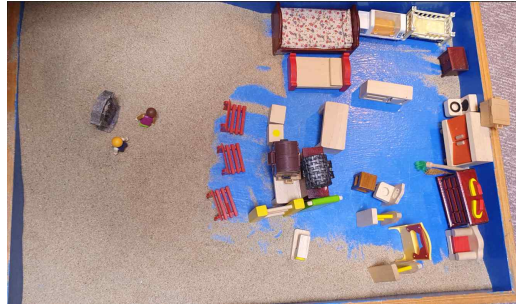
[그림 1] 2회기 모래놀이장면