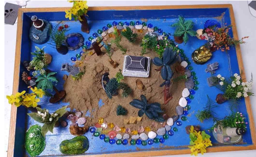
[그림 14] 19회기 모래놀이장면