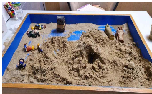
[그림 3] 6회기 모래놀이장면

마술적 남근 단계는 아직 모-자 단일체의 영약을 많이 받고 있는 단계(장미경, 2024)이지만, 자아가 분리를 향한 나아가기 시작한다. 이 단계에서는 신체-자기를 동일시함으로써 전지전능감을 느끼며 자아가 생겼다가 무의식으로 사라졌다는 반복하여 순달과 관련된 측면으로 보일 수 있다(장미경, 2024). 5회기에서 내담자는 자신의 모습과 치료자의 모습을 그림으로 그리고 게임놀이를 하였다. 6회기에서 내담자는 ‘치키’가 아빠를 죽이고 엄마와 살아남는 이야기를 통해 내면의 분노와 그림자를 표현하였다. 치키는 내담자의 그림자적 측면으로 자신을 보호해주지 못한 부모에 대한 분노와 자신에 대한 분노감, 수치심으로 상징될 수 있다. 동시에 자신을 ‘예수님’과 동일시하며 상황을 전지전능하게 통제하려 하였다. 또한 ‘경찰 새아빠’를 등장시켜 치키를 쫓아내는 장면은 자아가 마술적 권위를 빌려 스스로를 보호하기 시작했음을 보여준다. 경찰은 위기에 처한 사람을 구해주고 악인에 대한 심판자이자 권력과 통제와 관련되어 있다. 즉 위협으로부터 사람들을 수호나 보호해주는 히어로로