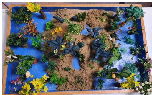
Figure 15. Sandpicture from Session 20