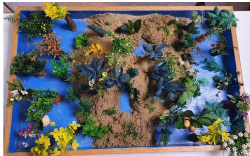
[그림 15] 20회기 모래놀이장면

18회기에서 내담자는 산을 만들고 주변에 다양한 남성 피겨들을 배치하며 분화된 여성 에너지를 통합하기 시작하였다. 이러한 중심화는 자기(Self)에너지가 배열되고 있는 것을 말하며 여기서 자아 에너지가 발달할 수 있다는 것이다(장미경, 2024). 또한 산은 모성의 상징이다(Cooper, 1978/1994). 남자들의 직업은 매우 다양하였다. 장난꾸러기, 사이코패스, 경찰, 건물 짓는 사람, 요리사, 공사하는 사람 등 부정적인 것도 있었으며 긍정적인 것도 있었다. 이는 내담자가 자신의 실제 아버지에 대한 부정적이고 긍정적인 측면을 모두 통합하기 위한 과정을 의미한다. 19회기에서 내담자는 모래상자 전체를 하나의 거대한 만다라 모양으로 만들었다. 만다라는 신성한 장소, 중심을 보호하는 테메노스의 의미를 가지고 있기도 하다(장미경, 2024). 동굴을 만들고 그 위에 경복궁을 두었으며, 다양한 문화유산을 배치하였