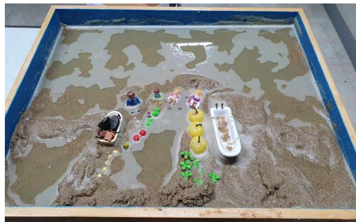
[그림 5] 8회기 모래놀이장면

7회기에서는 ‘의사 남편’을 통해 상처 입은 모성을 치유하고, ‘몰래 케이크를 먹는 세 명의 아이들’이 등장한다. 이는 결핍되었던 모성적 자양분(음식)을 자아가 스스로 획득하기 시작했음을 의미하며, 숫자 3은 통합의 상징으로 자아가 무의식과 의식 사이에서 균형을 이루고, 인격의 통합을 향해 나아가고 있다는 것으로 상징된다(Jung, 1964). 또한 내담자는 여자경찰이 태어났다고 이야기하였는데, 이는 ‘경찰 새아빠’가 보여준 외부적 통제력을 넘어, 이제 내담자 내면에서 스스로의 그림자를 조절하고 자아를 보호할 수 있는 심리적 힘(자아 에너지)이 구체적으로 생성되었음을 의미한다.