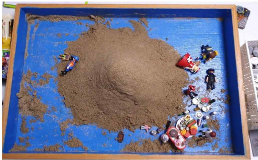
Figure 13. Sandpicture from Session 18

According to Neumann (1974/2007), the stage of totemism and paternal development, or the solar ego stage, is a period in which the ego breaks free from the maternal dominance of the unconscious, establishes the light and order of consciousness, and internalizes collective norms and values. At this stage, the ego acquires solar-like clarity of consciousness, exercising a legislative power that enables self-regulation and protection, and integrates inner opposites to form a solid ego-Self axis.