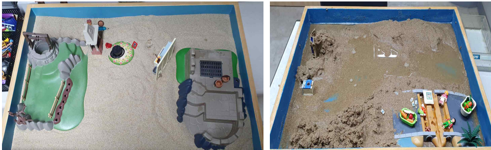
[그림 2] 3회기 첫 번째 모래놀이장면과 두 번째 모래놀이장면

1964). 그러한 기능을 하는 집을 튼튼하게 지어야 한다는 것은 현재 튼튼하지 않고, 모래폭풍처럼 나쁜 세상으로부터 자신을 보호하고자 하는 내담자의 바람을 의미하는 것으로 보인다. 또한 빗자루를 이용해 혼란스러운 곳을 정리하고 청소하는 것은 외상으로 인해 감당할 수 없는 압도적인 감정들을 정리하고자 하는 것으로 보인다. 3회기에서도 엄마와 아기가 사는 집을 만들었다. 엄마와 아기의 집은 음식 저장고였다. 또한 아기는 엄마가 음식을 좋아해서 자신은 원치 않는데 콜라를 마트에서 훔쳐왔다고 한다. 우물 속에 있던 아이가 배가 고프다고 엄마와 아기의 집에 찾아왔다. 그 아이는 29살인데 집이 없어서 아기와 엄마 집에서 재워주기로 했다고 한다. 음식은 애정을 상징하며(Chodorow, 1978), 그것들을 충분히 담아줄 수 있는 곳을 만들고자 하는 것으로 보인다. 아기는 엄마 대신 요리를 하고, 엄마를 기쁘게 해주기 위해 원치 않는데도 음식을 훔쳐 엄마에게 가져다주는 것은 부모화 된 내담자의 상태가 연상되었다. 또한 모래에 파묻혀 있는 화덕은 어머니가 우울한 감정상태에 빠져 제대로 기능하지 못했던 부정적인 모성으로 볼 수 있다.