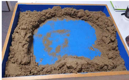
[그림 10] 14회기 모래놀이장면

12회기에서는 사막이 오아시스가 있는 숲으로 변하는 모래놀이장면을 만들었다. 오아시스는 메마른 땅에 있는 무의식적 자원으로 의식적인 세계와 소통하고 있음을 상징한다 (Cooper, 1978/1994; Jung, 1964). 이러한 오아시스(샘물)은 신비롭고 치유적인 성질을 가지고 있어 정화를 상징하기도 한다(Tresidder, 2000/2007). 즉, 고갈되었던 긍정적 모성 에너지가 회복되어 자아가 성장할 수 있는 비옥한 심리적 토대가 마련되었음을 의미한다. 또한 숲은 여성원리로 시련과 이니시에이션이 벌어지는 곳이며(Cooper, 1978/1994) 자신의 어두운 감정과 기억들이 있는 무의식의 상징이기도 하다(Fontana, 1993/1998). 즉 내담자는 자신의 무의식을 마주할 준비를 하는 것으로 보인다. 숲과 나무는 초록색이며 초록색은 생명력, 희망, 스트레스에 잘 대처하는 능력, 치유를 상징한다(Brennan, 1987). 점차 초록색으로 변하고 있