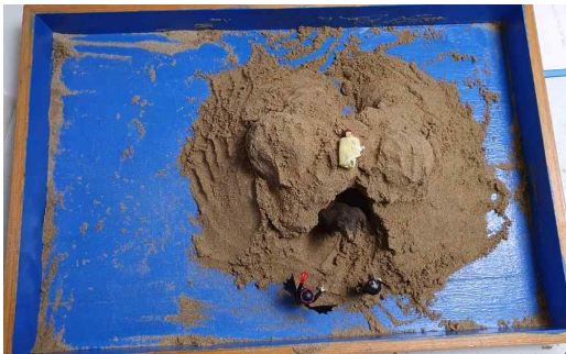
[그림 6] 10회기 모래놀이장면

마술적 전쟁 자아 단계는 모권에서 부권으로의 이동이 이루어지며, 자아가 무의식의 지배, 부정적 모성로부터 벗어나기 위해 본격적인 투쟁을 벌이는 시기이다(장미경, 2024). 이 단계에서 부권으로의 이동은 무의식(모성)이 주는 감정적 혼란과 트라우마에 머무르는 것이 아니라, 스스로 규칙을 세우고, 옹고 그릇을 가리며, 자신을 방어할 수 있는 힘을 기르는 과정을 의미한다. Neumann(1974/2007)에 따르면 이 단계의 자아는 무의식의 상징인 용(Dragon)에 맞서 싸우는 전사의 면모를 갖추며, 분열된 대극을 통합하고 자아의 영역을 확장하기 위해 파괴와 건설의 과정을 반복한다.