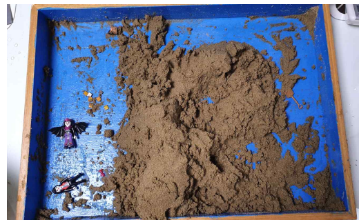
Figure 12. Sandpicture from Session 16

In session 15, the client created a cake decorated with jewels, creating a festive atmosphere. She placed blue and green jewels together as one on top of the cake. Green symbolizes primal and fundamental life energy, while blue symbolizes yin among yin and yang in East Asian traditions, that is, femininity (Cooper, 1978/1994). Thus, this symbolizes the union of the opposites, an attempt to integrate previously split psychological energies through the will of the ego. She also created the letters “♥Mom♥” and a snowman. A snowman consists of two circular shapes stacked vertically, which appears to represent the constellation of the Self and the beginning of ego independence (Jang, 2024). In session 16, the client engaged in