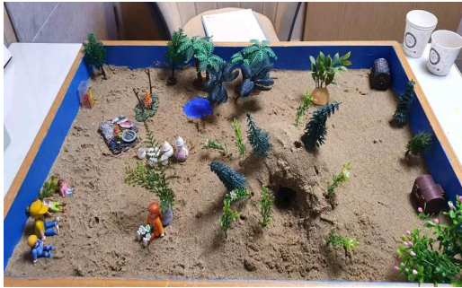
Figure 8. Sandpicture from Session 12

In session 10, the client introduced “vampire parents,” and the sandpicture in which the vampire father commits suicide and the mother dies by a bear's claws demonstrates the ego's struggle to psychologically eliminate negative parental energy that hinders growth. In the following session 11, the client confronts “zombies” attempting to capture newborn children. Zombies can be understood as entities that embody death in physical form, symbolizing the “inevitable reality of death” while simultaneously evoking fear (Kim, 2014). Zombies appear alive but are actually dead beings that act purely on an unconscious level. Thus, zombies seem to symbolize an ego state trapped in the unconscious, as well as frightening emotions associated with recurring trauma. This indicates that the ego is in an urgent state of war, striving to protect its emerging potential from unconscious threats (i.e., trauma).