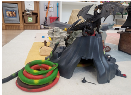
Figure 4. A Sandpicture Depicting the Symbolic Meaning of Insecure Mother, in Which Protection and Destruction Coexist

The following case presents a sandpicture from play therapy in which a child symbolically expresses maternal repression and ambivalent emotions through natural disaster-type and animal-type monsters—a volcano, a dragon, and venomous snakes. Child A, a 7-year-old boy, was unable to control his emotions when his requests were rejected by others, and as a result, he showed dangerous and impulsive behavior, such as running into the street. His father believed he had fulfilled his parental role through material support alone, while his mother avoided emotional interaction and took a passive stance toward discipline. This parenting style failed to provide the child with emotional security and stability, leaving him to grow up in an environment marked by internal conflict and confusion.