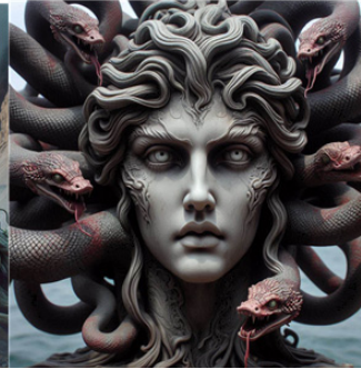
[그림 3] 고르곤 (AI)

동물형 괴물은 본능적 힘, 자연의 위협, 파괴성과 같은 원초적 속성을 상징한다. 예를 들어 히드라는 머리를 자를수록 늘어나는 특징을 통해, 억압된 감정이 더욱 증폭되는 모성 콤플렉스의 통제적 속성을 나타낸다. 이는 보호와 양육을 상징하는 어머니가 억압적이고 위협적인 존재로 전환되는 심리적 메커니즘을 보여준다(Neumann, 1974/2009). 또한 고르곤은 공포와 냉혹함을 지닌 파괴적 모성의 원형적 이미지로 해석되며 소피아와 같은 지혜의 모성과 대비된다(Neumann, 1974/2009).