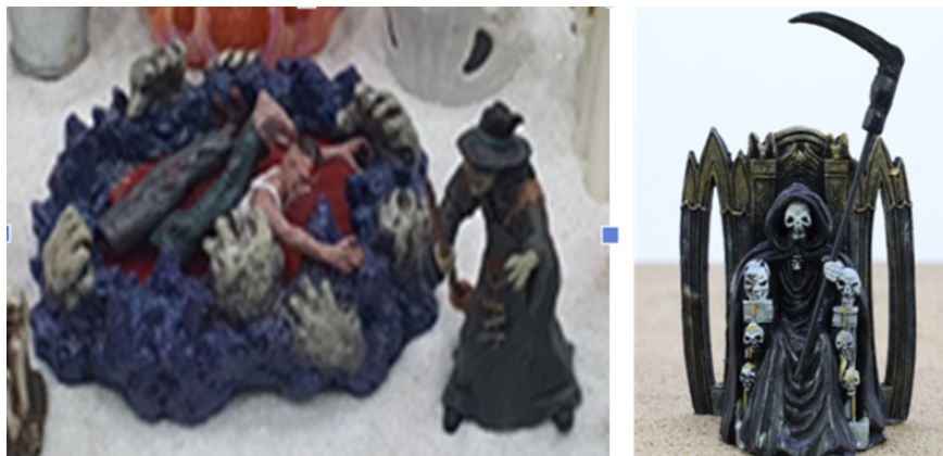
Figure 6. A Sandpicture Symbolically Representing Repressed Shadow Emotions and Anxiety in the Unconscious

was often emotionally anxious and tense, paying close attention to others' reactions and attempting to control her child's words and actions. The father, in contrast, was unconcerned with others' opinions and emphasized blunt, assertive expression. This clash in parenting styles created confusion for the client. As he tried to meet both parents' expectations, he frequently suppressed his own emotions and desires.