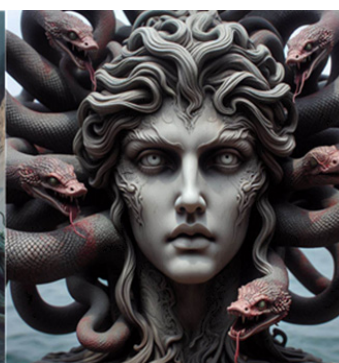
Figure 3. Gorgon (AI)

Animal-type monsters symbolize primal forces such as instinctual power, the threat of nature, and destructive energy. For example, the Hydra, whose heads multiply when cut off, represents the controlling aspect of the mother complex, where repressed emotions intensify. This shows the psychological mechanism by which the nurturing and protective mother turns