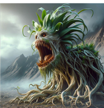
Figure 2. Ent (AI)