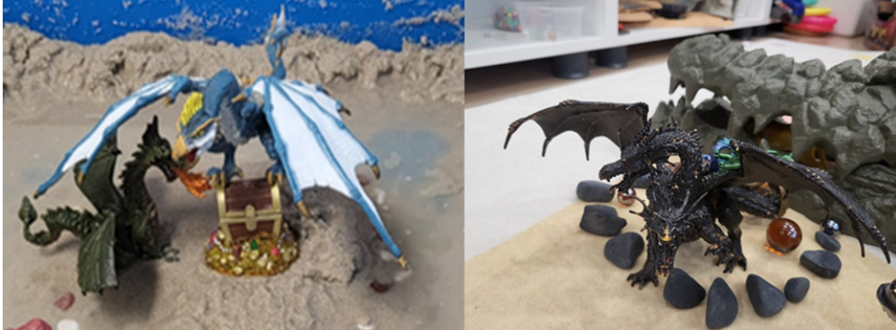
[그림 7] 보물을 지키는 수호자로서의 용의 형상을 통해 통과의례적 시련과 내면의 성장 과정을 상징하는 모래 장면