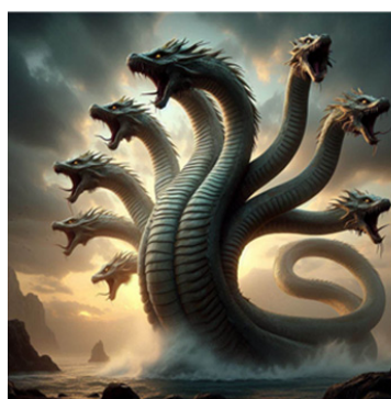
Figure 1. Hydra (AI)