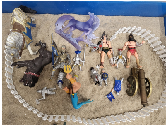
Figure 5. A Sandpicture Depicting Inner Conflict Toward Maternal Control and a Psychological Attempt to Restore Autonomy

The following sandpicture by Child B (a 12-year-old boy) shows, as seen in Figure 5, a fierce battle involving an animal-type monster (Cerberus), a hybrid-type monster (Poseidon), a natural disaster-type monster (water spirit), and humans (ancient soldiers).