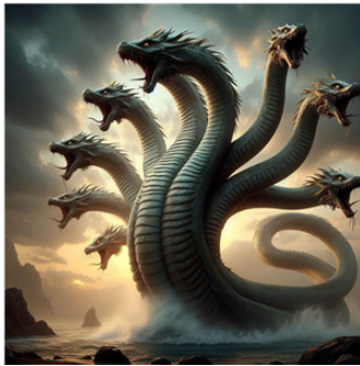
[그림 1] 히드라 (AI)