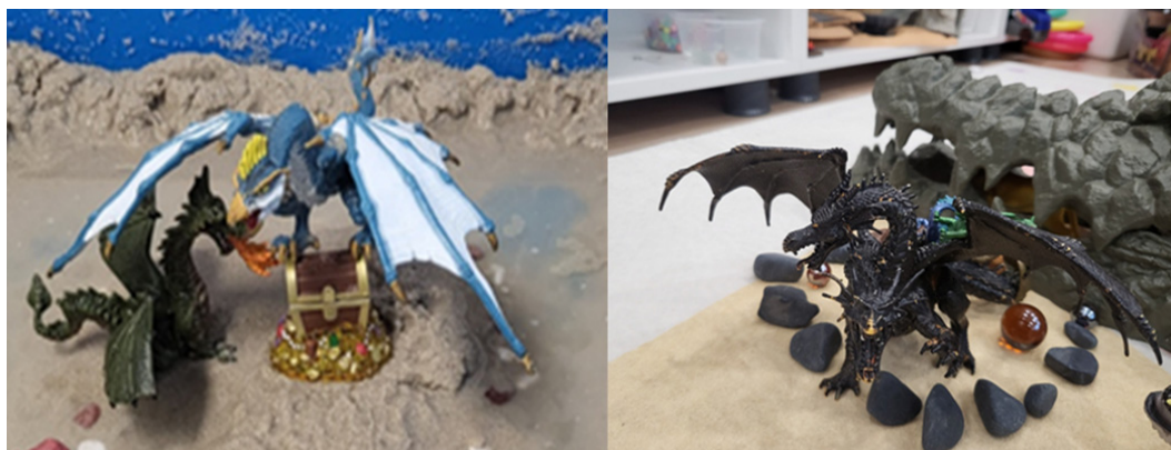
Figure 7. A Sandpicture Symbolizing Rites of Passage and Inner Growth Through the Image of a Dragon as Guardian of the Treasure

In children's sandpictures, the dragon guarding a treasure symbolizes a trial, suggesting that only by overcoming it can one reach the true treasure. The monster is not merely an object of fear, but a symbol of the values that humans hold dear and the inner journey required to protect them. The monster guarding the treasure is often associated with the sacred and is portrayed as a guardian of holy places linked to it. Additionally, the monster appears as a symbolic figure guarding the gates of the underworld, through which the souls of the dead must pass (Neumann, 1974/2009; Lee, 2010).