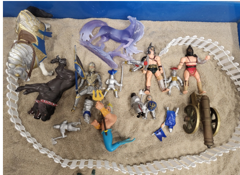
[그림 5] 모성적 통제에 대한 내적 갈등과 자율성을 회복하려는 심리적 시도를 보여주는 모래놀이 장면

부모의 감정적 단절과 냉담한 반응 속에서 느끼는 무력감과 분노를 반영한다고 볼 수 있다. 이 분노는 발달 과정에서 정서적 지지를 받지 못하고, 자신의 감정이나 욕구가 반복적으로 수용되지 않거나 거절당함으로써 축적된 것이다. 특히 자율성과 자기표현이 억압될 때 형성되는 좌절과 거절감에서 비롯된 감정으로, 아동은 이를 통제 불가능한 자연재해의 형태로 표상한 것이다.