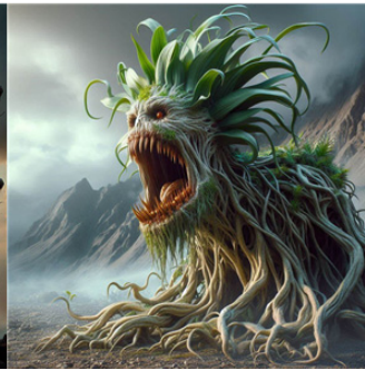
[그림 2] 엔트 (AI)